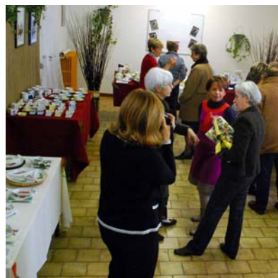
La Mostra del Corso