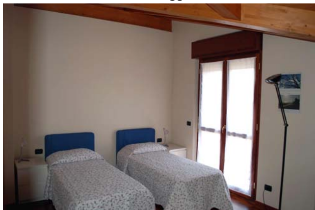
Foto 3 - Camera blu