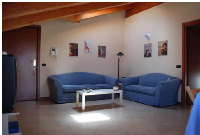
Foto 1 - Soggiorno

CASA MARTA dispone di 3 stanze (6 posti letto) + servizi e di un soggiorno comune con cucina attrezzata (V. Foto 1-4), accessibili anche a i portatori di handicap motorio ed è situata a Cologno M.se (MI), via Ginestrino 13 (cfr. Mappe), a 150 m dalla fermata di Cologno Nord, Metropolitana Milanese (Linea Verde) e molto ben collegata con Milano; ad esempio, si può raggiungere l' Istituto dei Tumori in meno di 30 minuti.