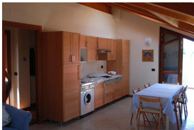
Foto 2 - Pranzo-cucina